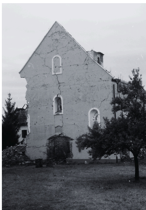
Ostaci crkve sv. Antuna Padovanskog u Hrvatskom Čuntiću