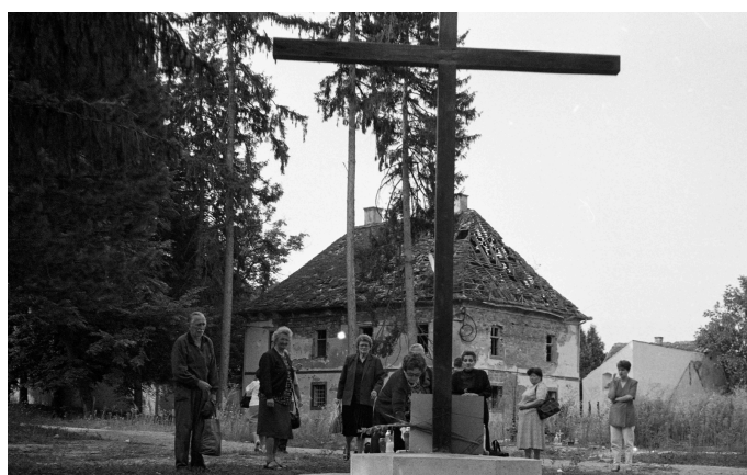
Mjesto crkve sv. Lovre u Petrinji