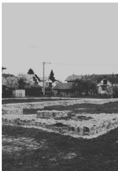
Ostaci temelja crkve sv. Ivana Nepomuka u Glini