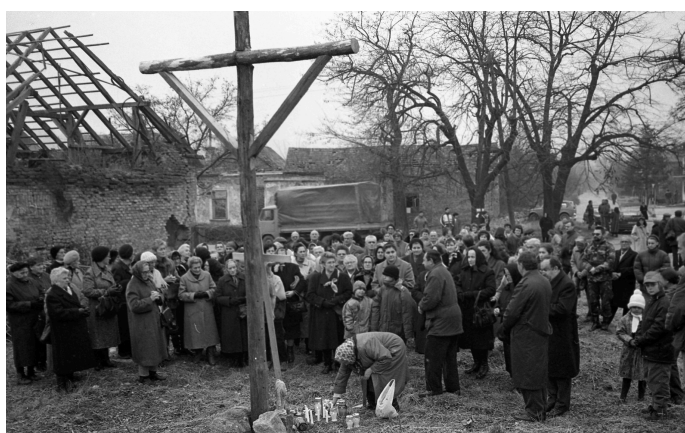
Mjesto crkve sv. Katarine u Petrinji